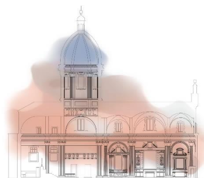
Chiesa del Voto

Presso la Chiesa del Voto è possibile acquistare i nostri CD e DVD e il nostro merchandising per sostenere l'Associazione.